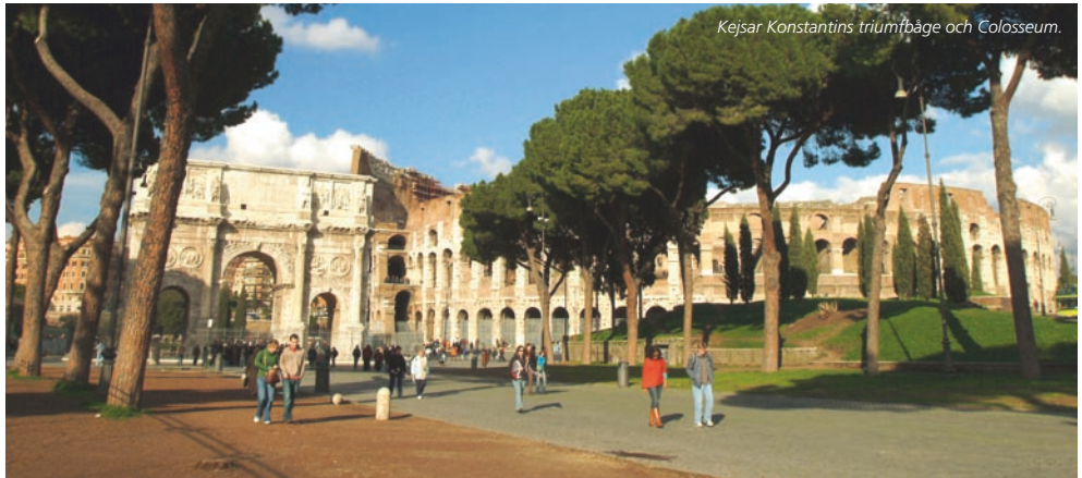
Kejsar Konstantins triumfbåge och Colosseum.