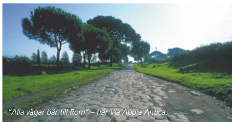
"Alla vägar bär till Rom" – här Via Appia Antica.

Villa Torlonia: Vacker 1800-talsvilla där Mussolini bodde (hans bunker kan också beses), fika i det nyrestaurerade orangeriet, Via Nomentana 70, ett stenkast från affärscentrum.