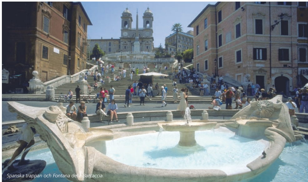
Spanska trappan och Fontana della Barcaccia.

Långfredagskvällens golgataprocession utgår från Colosseum. Påven välsignar folket på Piazza S. Pietro påskdagen och juldagen – här lär du inte bli ensam, 300.000 personer får plats på torget. Info: www.vatican.va .